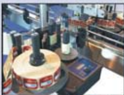
Double Head Labeller