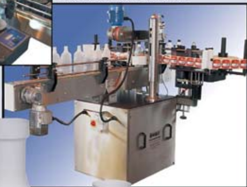
Conveyor and Labeller