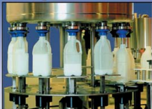
Rotary Filling Machine