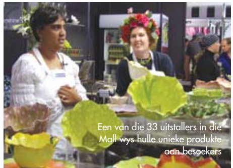
Een van die 33 uitstellers in die Mall wys hulle unieke produkte aan besoekers

mense wat die fees jaar ná jaar lok. "Agri-Expo het homself oortref deur die fees te vernu en feesgangers se belangstelling te behou," sê hy.