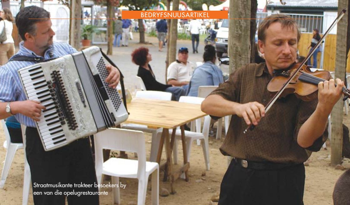
Stratmusikante trakteer besoekers by een van die opelugrestaurante

Agri-Expo, wat vanjaar sy 175ste bestaansjaar vier, het hierdie jaar besoekersgetalle met 1 000 mense per dag verminder en die uitleg van die fees herstein, om skares beter te beheer